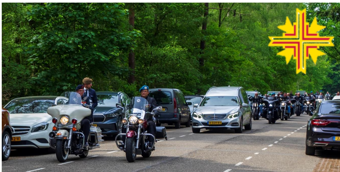
“Het Ere- escorte van Veteranen op motoren.”