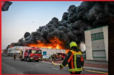
Het verhaal van Ralph.