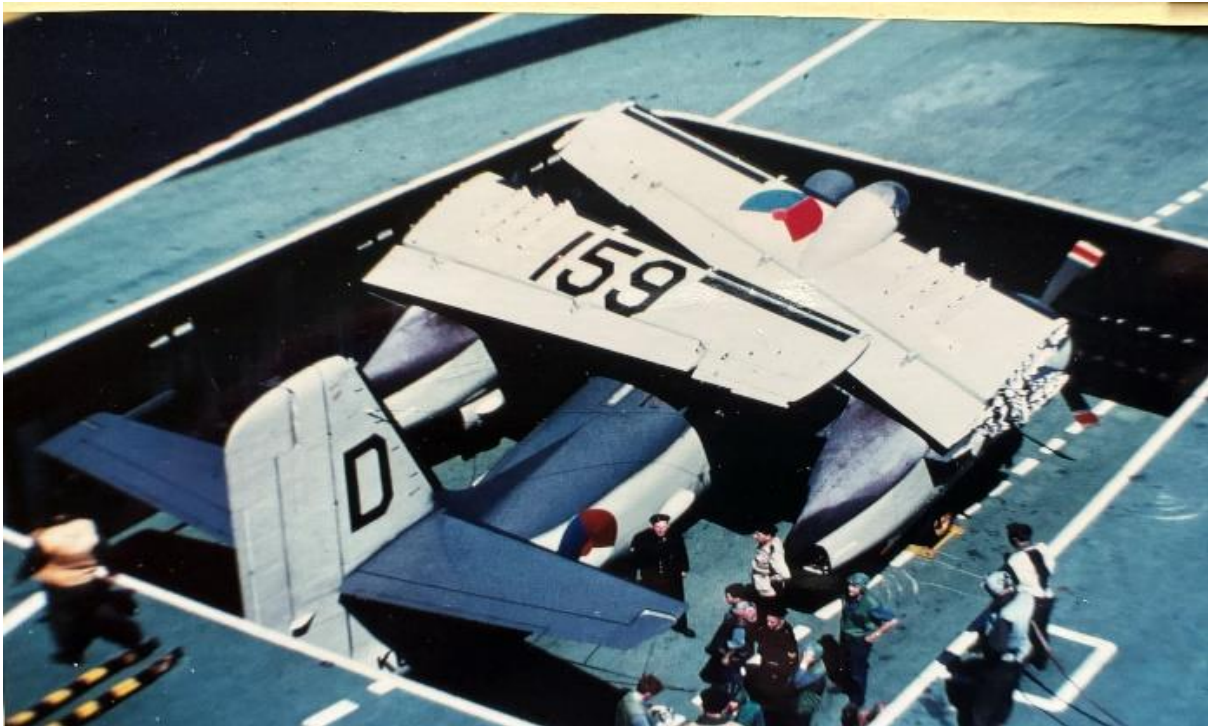
“Grumman Tracker aan boord van de Hr.Ms. Karel Doorman.”

Als 2-jarig ukkie heb ik bij mijn vader op de arm naar een Grumman Tracker (S-2F) gekeken die heel laag over onze flat vloog en waarbij in het donker alle lampjes zichtbaar waren. Er werd geoefend met nachtvliegen en ik vond dat geweldig mooi om te zien en te horen.