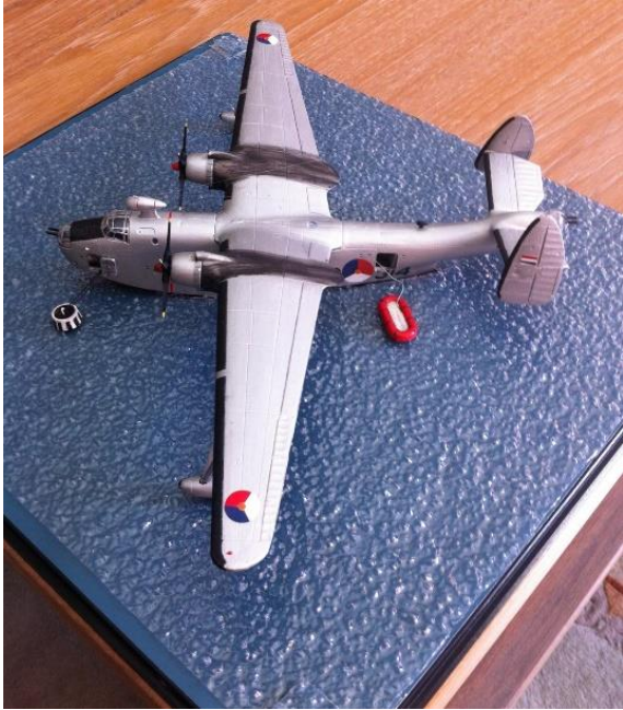
“Modelbouw... Martin Mariner”

Mijn vader heeft gediend in De Oost, De West, en op diverse schepen w.o. de Hr.Ms. Karel Doorman. Er werden bij mij thuis ook regelmatig Maleise woorden gesproken en dat maakte mijn interesse in alles wat met de marine en Nieuw-Guinea te maken had alleen maar groter. Een hobby die wij vroeger deelden, was modelbouw; van alles, maar vooral vliegtuigen van de MLD.