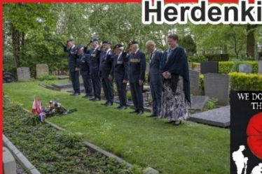
Herdenkingen in Oegstgeest.