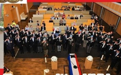
Uitvaart Erevoorzitter UNV.