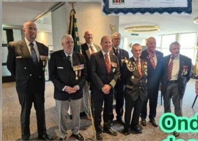
Ondersteuning door de SOEK.