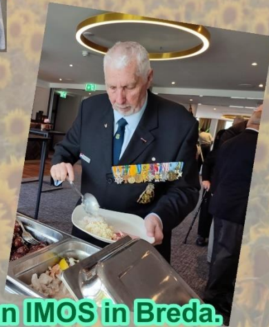
Bezoek aan IMOS in Breda.