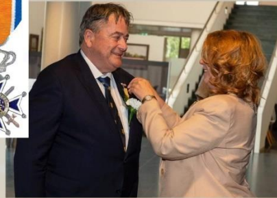
Teylinger Veteranendag in Voorhout.