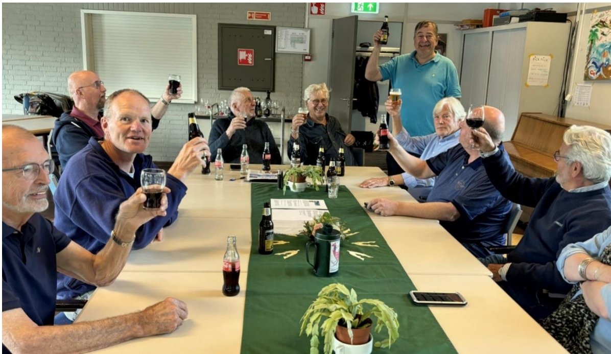
“Een toast op Lodewijk!”