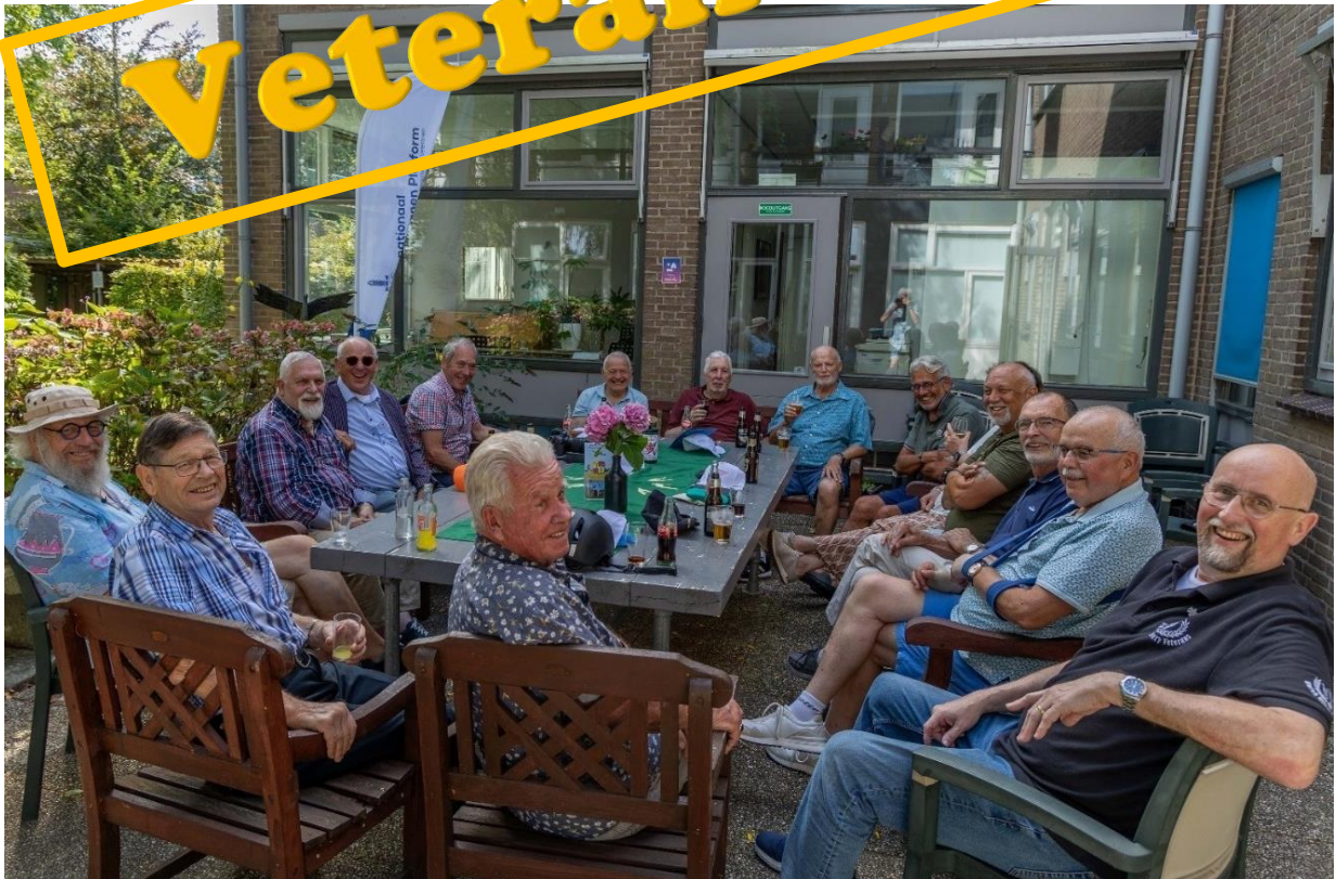
8 augustus 2024, Het Veteranencafé in de tuin van het Dorpscentrum.