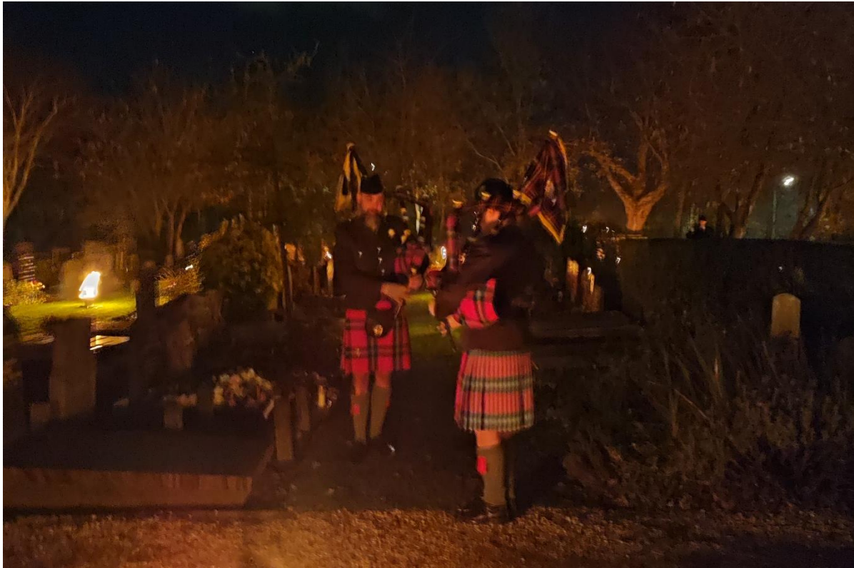
“Doedelzakspelers van The Red Rose of Lochbuie Pipes and Drums”.

Medio 1942 was het aantal Duitse doden op het “Heldenfriedhof” zo toegenomen, dat de Geallieerden tussen de Duitsers dreigden te komen liggen. De Oorlogsgraven zijn toen verplaatst naar de plek waar ze nu nog liggen. Alle Duitse graven zijn in 1948 overgebracht naar de Duitse militaire begraafplaats in het Limburgse Ysselsteyn, die met bijna 32.000 graven de grootste militaire begraafplaats in ons land is. Voor de geïnteresseerde lezers: Het artikel van Jaap Plokker is te lezen via www.rijnlandgeschiedenis.nl