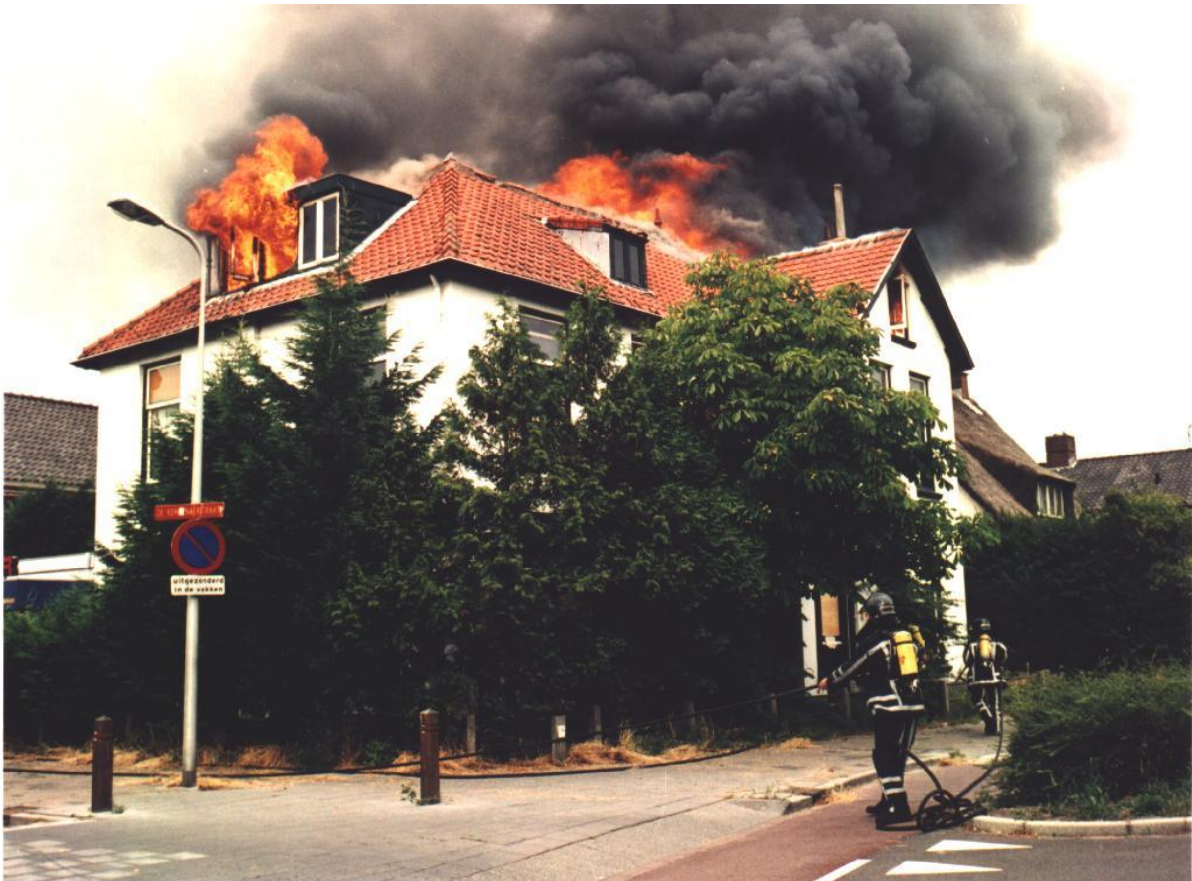
"Brand op de hoek Kempnaer / Warmonderweg".

Valkenburg, goed laten smaken. Zondagmorgen 07.00 uur precies melde ik me bij de directiekamer. Nou daar zat wat goud! Officieren van het Ministerie, Marechaussee en natuurlijk de directeur MEOB. De eerste woorden die hij zei waren: "Dit is de persoon die de leiding heeft". Nou daar sta je dan weliswaar met je brandweer ervaring, maar nog nooit zoiets meegemaakt. De woordvoerder van het Ministerie vertelde mij terloops dat ik tekenbevoegdheid kreeg tot fl. 1.000.000, (ja een miljoen gulden!) voor het opruimen van de resten. Ik ben net binnen budget gebleven, want de aasgieren van de gespecialiseerde bedrijven, zien "Ministerie" en hup daar komt de vork om mee te schrijven. De galvanische afdeling is nooit meer in gebruik genomen. Later is mij, door deze ervaring, nog advies gevraagd voor het opruimen van de resten van een scheepsbrand. Een van de mijnenjagers had bij Noorwegen flinke brandschade opgelopen en men wilde het e.e.a. van mij weten, hoe en wat te regelen.