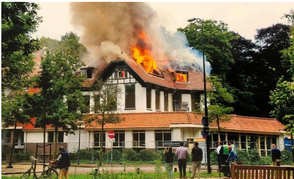
"Het Witte Huis in vlammen".

Uitkijken voor ontploffende gasflessen in de boten terwijl je blust. Kom ik 2 januari op werk zegt een collega: "Waar bleef de brandweer toch? Ik zag het om half twaalf al branden en jullie kwamen over twaalven pas". Ik vroeg hem waarom hij de brandweer niet om half twaalf had gebeld, antwoorde hij: "Oh, ik dacht dat iemand anders dat wel zou doen".