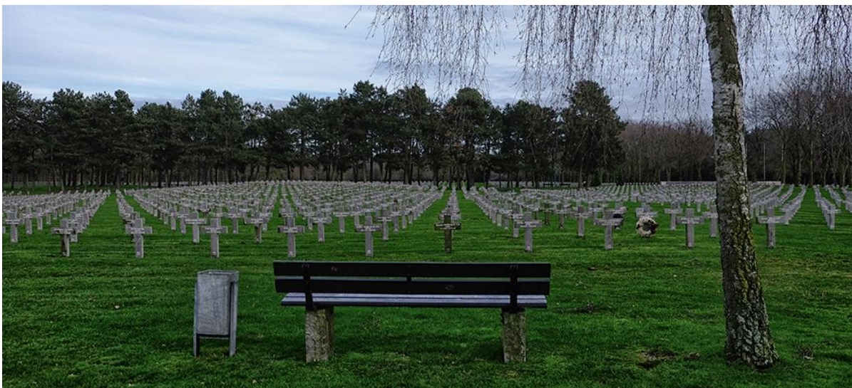
"Duitse Militaire Begraafplaats Ysselsteyn."