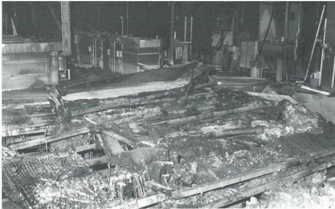
"Het beitsgedeelte van de galvanische ruimte platgebrand".