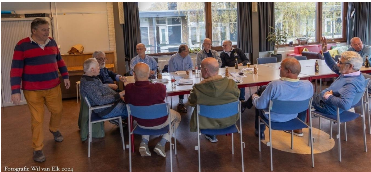
Fotografie Wil van Elk 2024

Op donderdag 11 april j.l. was het weer tijd voor het Veteranencafé, zoals altijd weer in het Dorpscentrum in Oegstgeest. Tussen 16.00 en 18.00 uur waren er zo'n 20 bezoekers in de “Bomenzaal”.