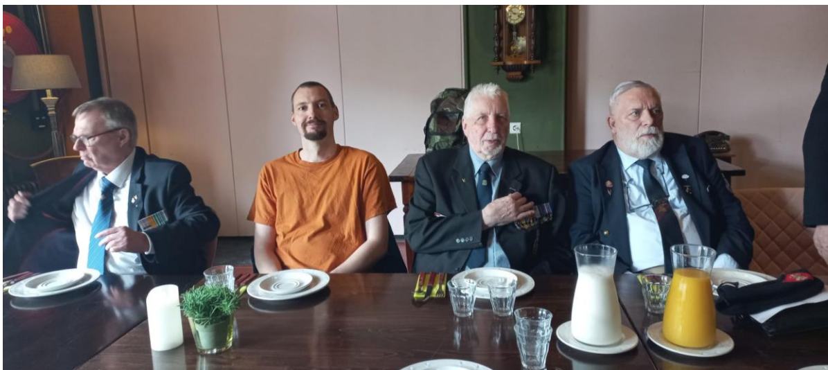
“In afwachting van de Brabantse Lunch”.

De presentatie werd verzorgd door de Kapitein van Administratie b.d. Eltik en ging over de afhandeling van het neerschieten van vlucht MH17. Daar is middels de pers indertijd veel over bekend geworden; de beelden van de terugkeer van de stoffelijke resten op de Vliegbasis “Eindhoven”, staan bij veel mensen waarschijnlijk nog op het netvlies gegrift. De “Power Point Presentie” was zeer interessant en werd uitgebreid ondersteund door veel foto- & filmmateriaal. Een aantal dingen zijn bij het grote publiek niet bekend en nu kon men “in de keuken kijken”, van de afhandeling van de vliegcrash. De spreker was al enkele dagen na het gebeuren aanwezig bij de “crash-site” in het Separatisten-gebied en heeft in de weken, dat hij in de Oekraïne verbleef, best wel heftige dingen meegemaakt. Het betoog was dan ook zeer boeiend en een aantal aanwezigen, kon tijdens het verhaal vragen stellen over e.e.a. Omdat het Café-Restaurant “Boerke Mutsaers” direct aan de spoorlijn Breda-Tilburg grenst, trilde het beeldscherm soms hevig, als er weer een personen- of goederentrein voorbijreed. Het leek dan even, of er weer een Buk-raket werd afgevuurd.