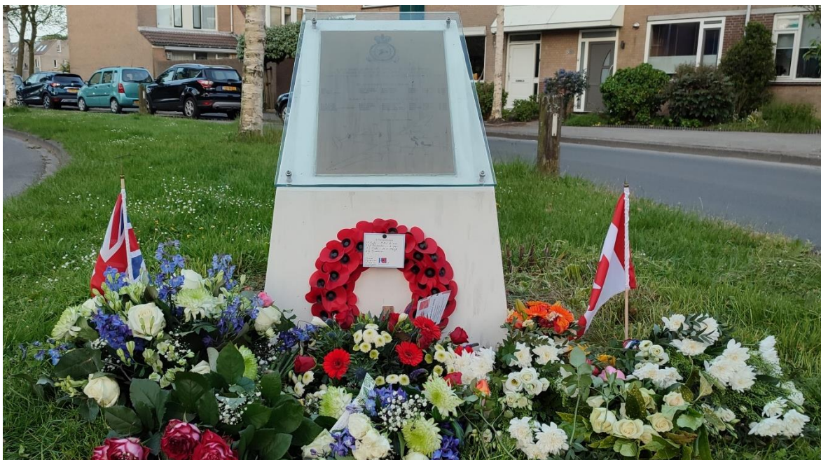
"Het Halifax monument aan de Kleyn Proffijntlaan te Oegstgeest".

Onze gehele achterban is hierbij van harte uitgenodigd, niet alleen de Veteranen.