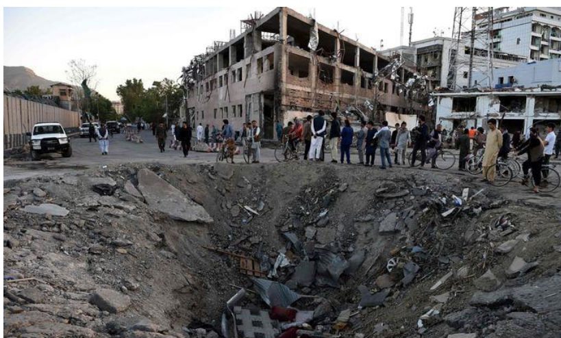
De krater na de aanslag 3 .

Goed, ik maak weer een sprong in de tijd en we leven in 2017. Ik was intussen kolonel geworden en ik was weer toe aan een nieuwe functie toen ik een telefoontje kreeg. De vraag was of ik naar Afghanistan wilde om daar hoofd Personeel en Organisatie (Hoofd J1) te worden van de NATO-missie Resolute Support. Ach, je bent 55 jaar en je hebt wel zin in een avontuur dus na overleg thuis heb ik ingestemd. Ik zou van mei tot en met december 2017 worden uitgevonden en tussendoor zou ik een keer met verlof mogen gaan. Begin mei ben ik naar Kabul gegaan en nadat ik goed en wel de functie had overgenomen was het tijd voor een kopje koffie. Mijn kantoor was op het hoofdkwartier van NATO in een container en ik loop rustig naar buiten. Op dat moment hoor ik een explosie en ervaar ik een enorme drukgolf. Dit was een explosie van een, met explosieven geladen, tankwagen die voor de ambassade van Duitsland was gereden. De Duitse ambassade bestond uit twee grote gebouwen waarvan de eerste nu niet meer te gebruiken was. Ik werd door de drukgolf tegen de grond geduwd en hierna wist ik nog beter dat het in Afghanistan erg instabiel was. De aanslag zelf heeft helaas het leven gekost van zo'n tachtig tot negentig omstanders die op het verkeerde moment op de verkeerde plek stonden.