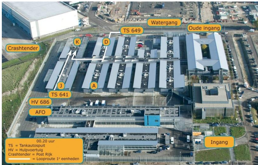
Het cellencomplex op Schiphol Oost.

Goed, ik maak weer een sprong in de tijd en we leven in 2017. Ik was intussen kolonel geworden en ik was weer toe aan een nieuwe functie toen ik een telefoontje kreeg. De vraag was of ik naar Afghanistan wilde om daar hoofd Personeel en Organisatie (Hoofd J1) te worden van de NATO-missie Resolute Support. Ach, je bent 55 jaar en je hebt wel zin in een avontuur dus na overleg thuis heb ik ingestemd. Ik zou van mei tot en met december 2017 worden uitgevonden en tussendoor zou ik een keer met verlof mogen gaan. Begin mei ben ik naar Kabul gegaan en nadat ik goed en wel de functie had overgenomen was het tijd voor een kopje koffie. Mijn kantoor was op het hoofdkwartier van NATO in een container en ik loop rustig naar buiten. Op dat moment hoor ik een explosie en ervaar ik een enorme drukgolf. Dit was een explosie van een, met explosieven geladen, tankwagen die voor de ambassade van Duitsland was gereden. De Duitse ambassade bestond uit twee grote gebouwen waarvan de eerste nu niet meer te gebruiken was. Ik werd door de drukgolf tegen de grond geduwd en hierna wist ik nog beter dat het in Afghanistan erg instabiel was. De aanslag zelf heeft helaas het leven gekost van zo'n tachtig tot negentig omstanders die op het verkeerde moment op de verkeerde plek stonden.