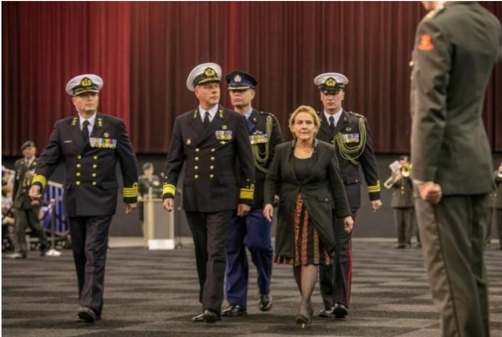
In Zwolle als paradedcommandant van de medaille ceremonie voor uitgezonden militairen met de Minister van Defensie en de Commandant der Strijdkrachten

Ik heb hierna een prima uitzending gehad maar dit moment blijf ik mij altijd herinneren. Daarnaast merk je dat je bij een volgende aanslag, relatief, lauw en koel reageert. Een ander memorabel moment was de expositie van een fotograaf. Hij had bepaalde markante punten in Kabul op foto vastgelegd in 2007 en 2017. In deze vergelijking zag je duidelijk de ontwikkeling (en vooruitgang) die er werd geboekt. Helaas is deze ontwikkeling teniet gedaan door het vertrek van NATO.