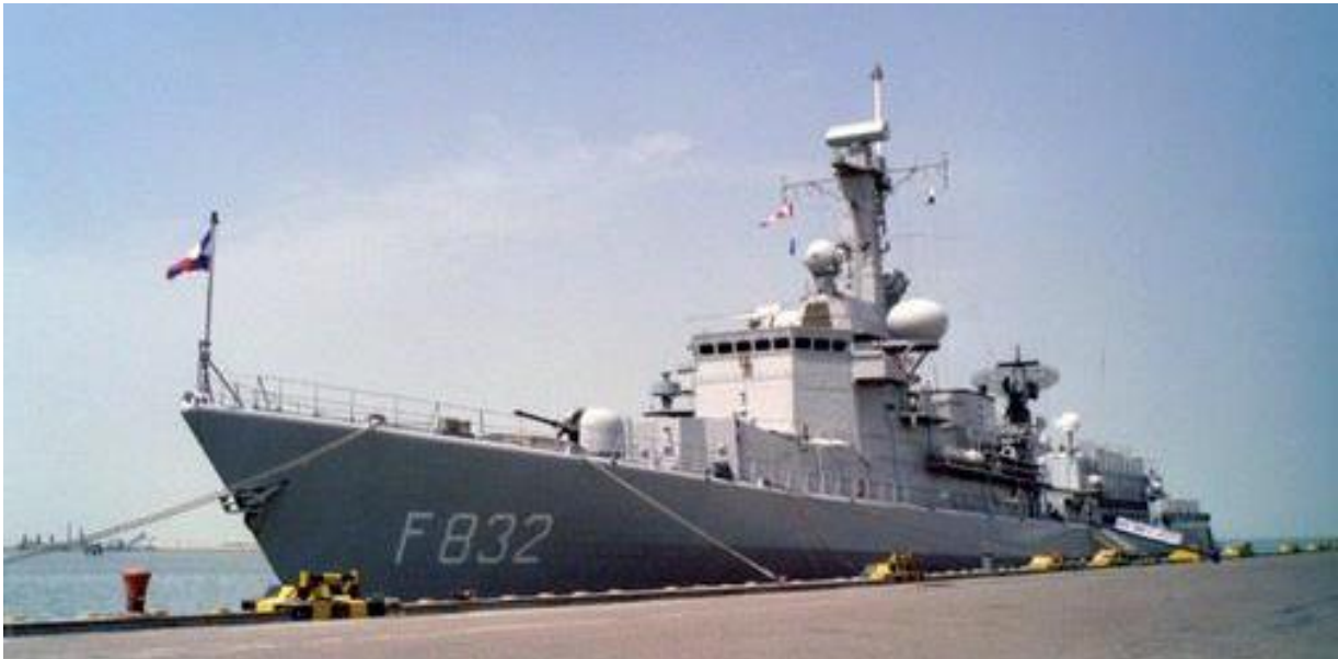
Hr.Ms. Abraham van der Hulst